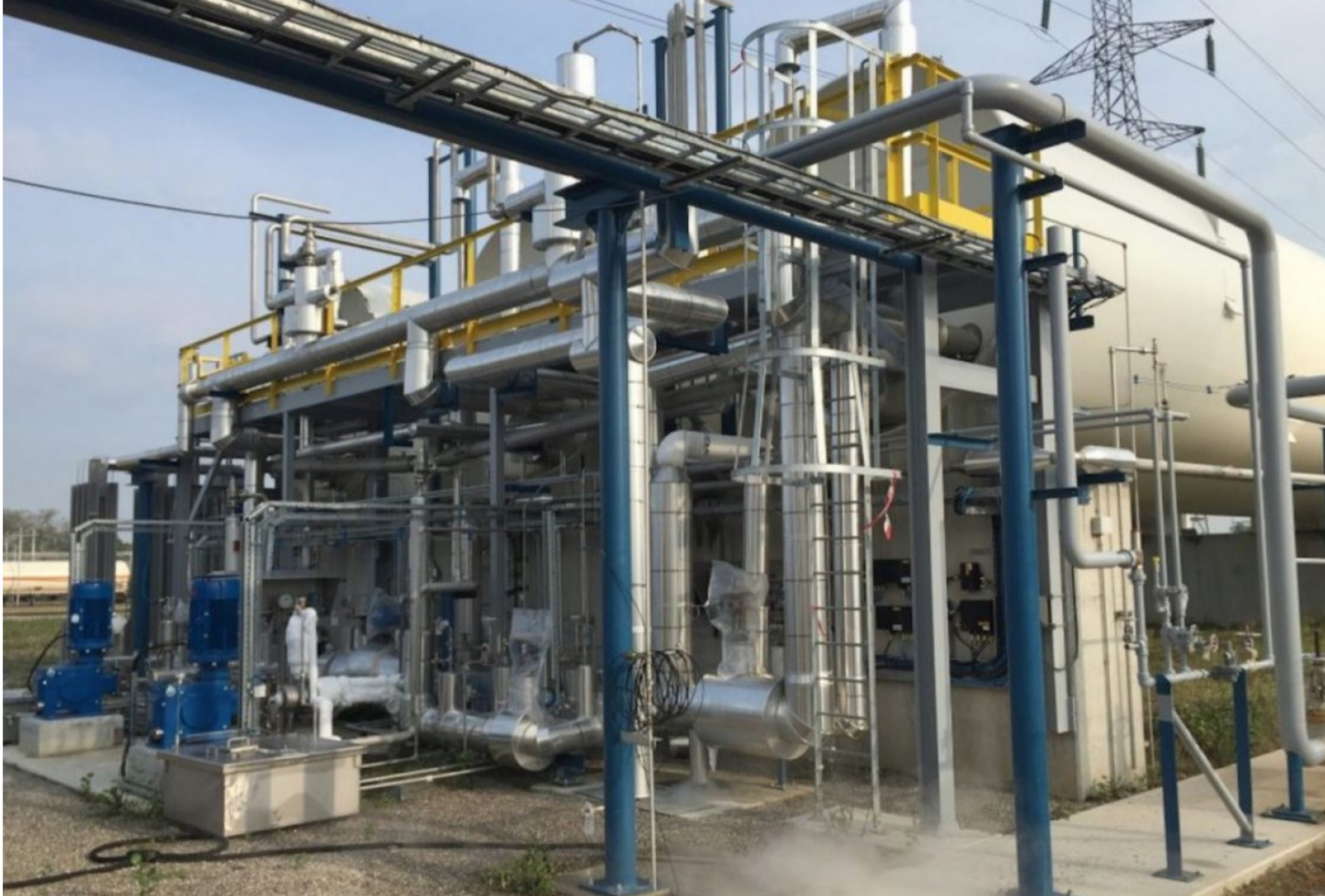
Alsace CST et CSimu constituent un pôle de compétences complémentaires, l'ingénierie et la fabrication de produits chaudronnés.

Publié le 05 novembre 2020 par Mathieu Noyer