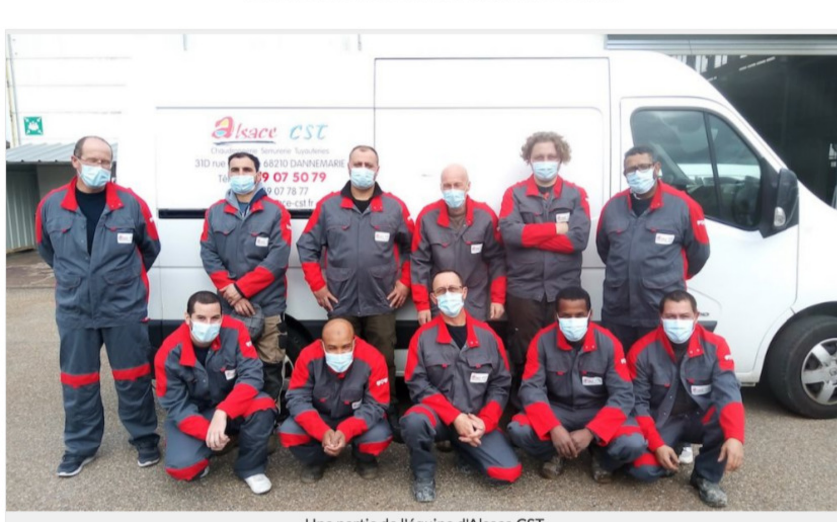
Une partie de l'équipe d'Alsace CST.

Celui-ci lui a servi de tremplin pour passer dans le monde de l'entrepreneuriat. C'est en 2014 qu'il a fondé le bureau d'études ingénieuriste CSimu.