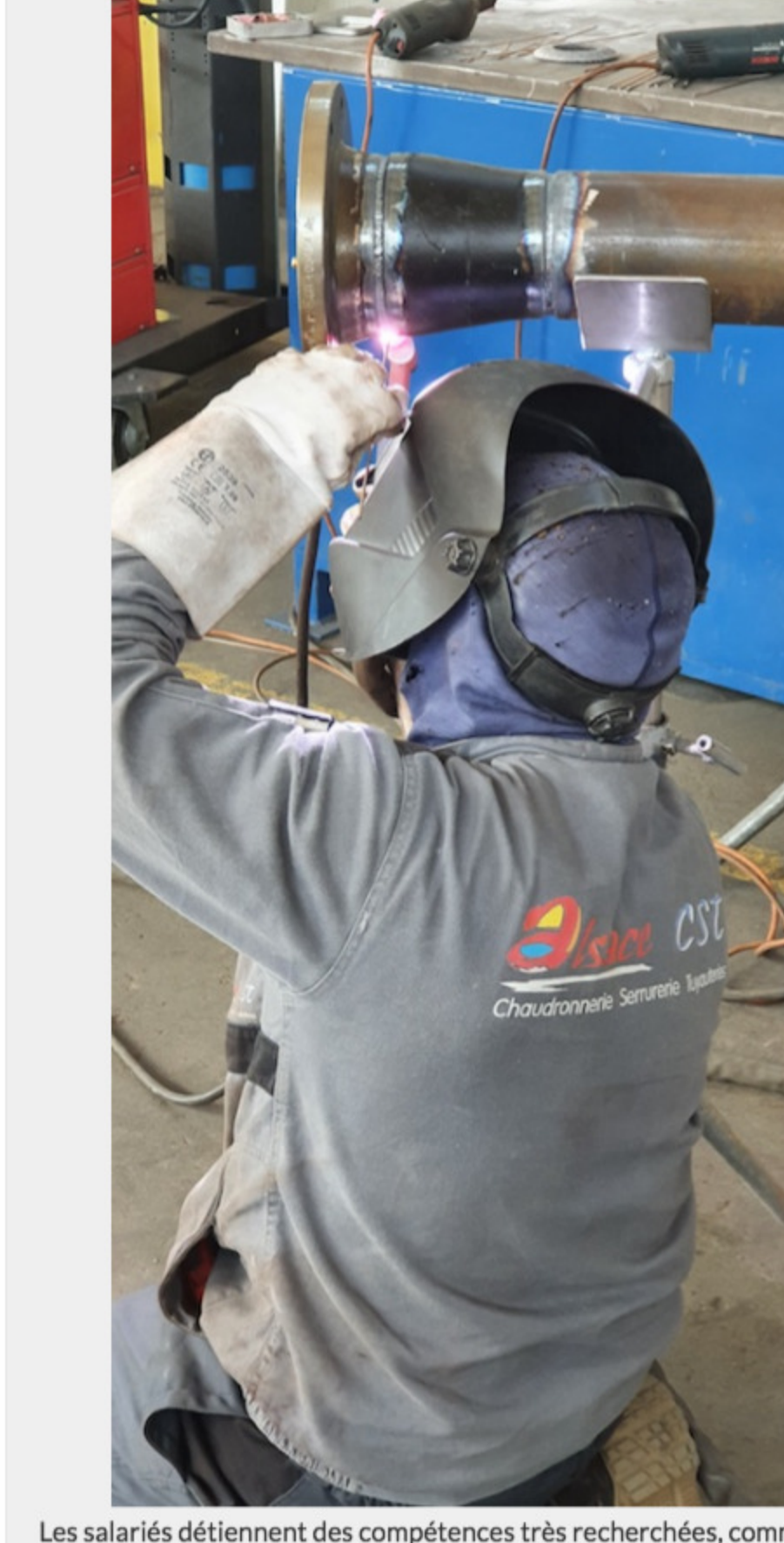
Les salariés détiennent des compétences très recherchées, comme ici la soudure.