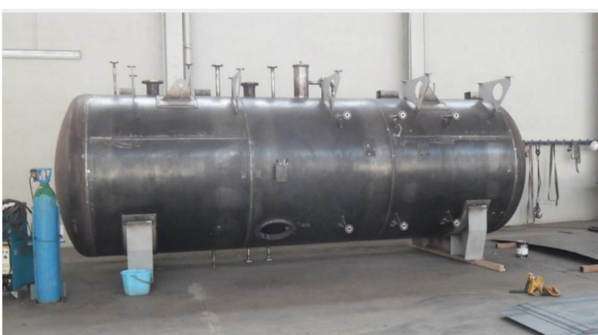
Un exemple de cuves que fabrique Alsace CST.

La reprise ne s'accompagne pas d'investissements majeurs, dans un premier temps. Les précédents dirigeants ont laissé un équipement à jour, comportant du matériel à commande numérique : cisaille et scie à ruban.